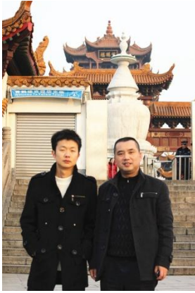
剪影一：学员们参观湖北省博物馆，游览黄鹤楼、汉口江滩，感受荆楚文化