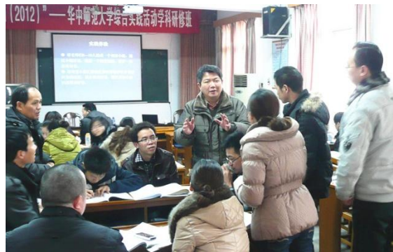
剪影三：学员们课上课下的欢乐瞬间